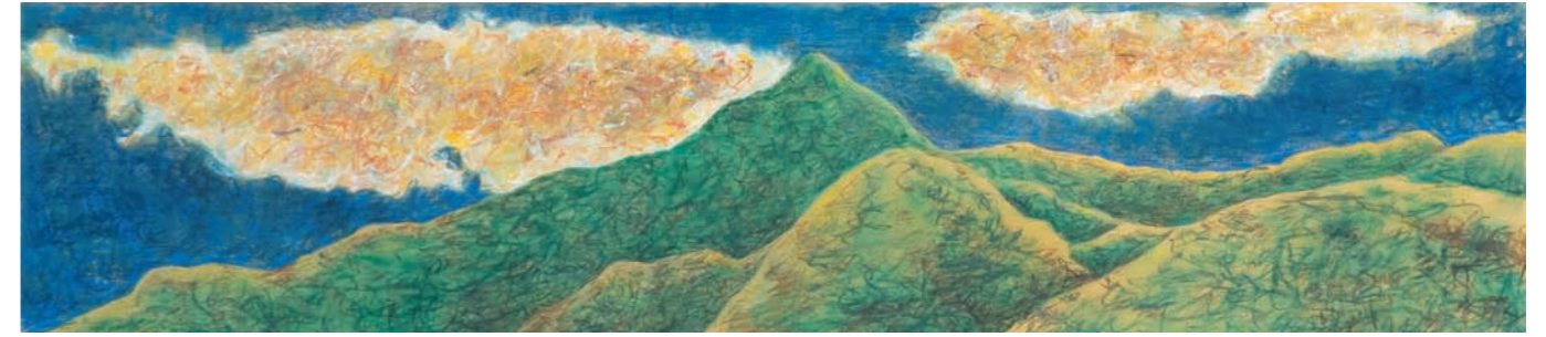
ÁVILA CAPRICHOSO, 2007-8