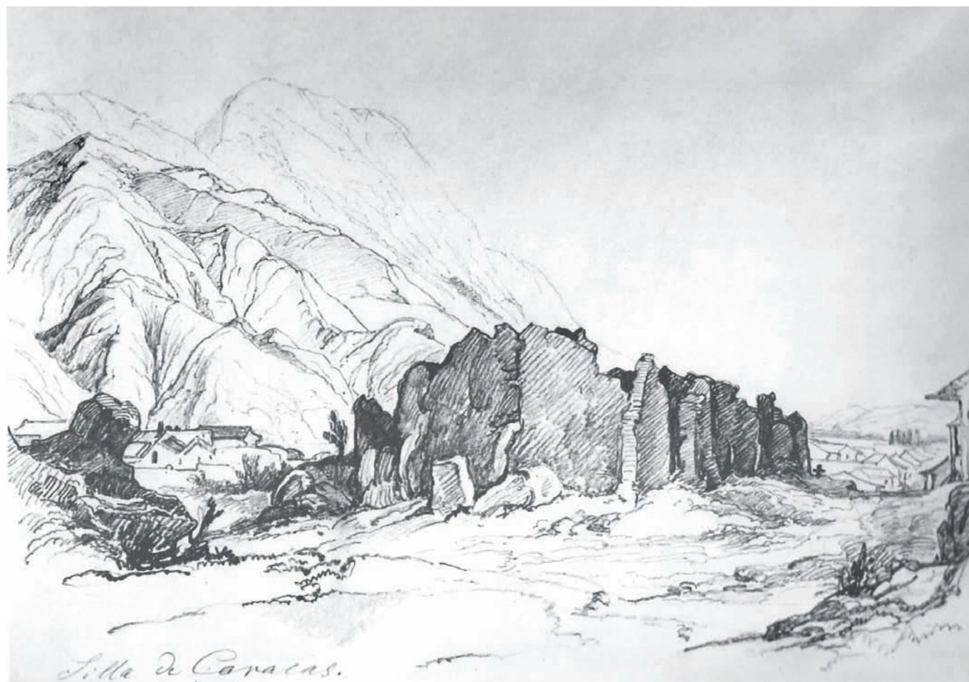
SILLA DE CARACAS. Lápiz, 27 x 24 cm, FERDINAND BELLERMANN Reproducción tomada de "BELLERMANN y el paisaje venezolano 1842-1945"

Uno de los principales ritos ciudadanos cumplidos por los caraqueños diariamente es ver la montaña caer bien de mañana en sus recién abiertos y aturdidos ojos que van llenándose poco a poco con la galopante luz que recorre sus laderas. Es la misma montaña que, desplegándose en diversas formas y colores, enmarca una jornada de trabajo urbano apoderándose de la imaginación y es la misma montaña que, emergiendo misteriosamente desde el fondo iluminado del valle, sube como un lomo oscuro y plano para desaparecer virtualmente en la oscuridad propuesta por las noches.