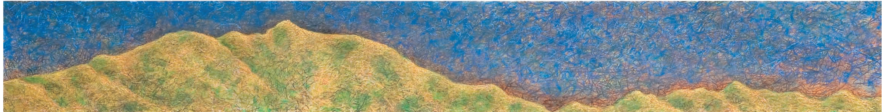
ÁVILA DESPIDIENDO EL DÍA, 2007-8