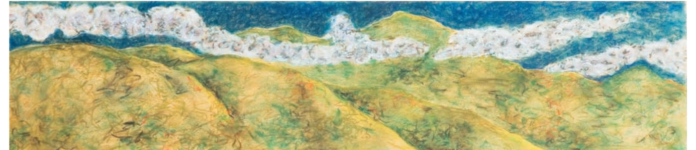
ÁVILA CÓMPLICE, 2007-8