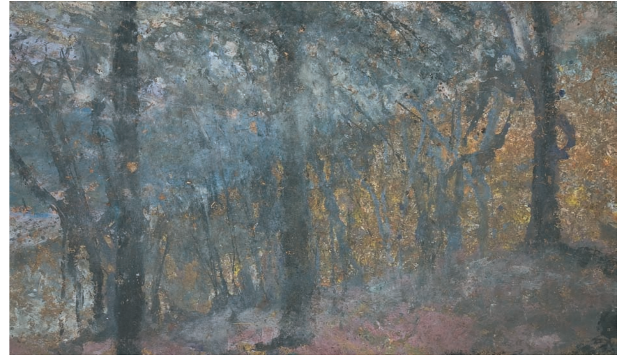
SUBIDA A QUEBRADA PAJARITO, 2000