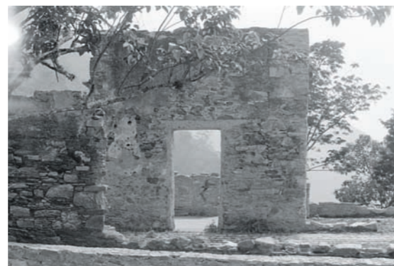
CAMINO REAL, 1982