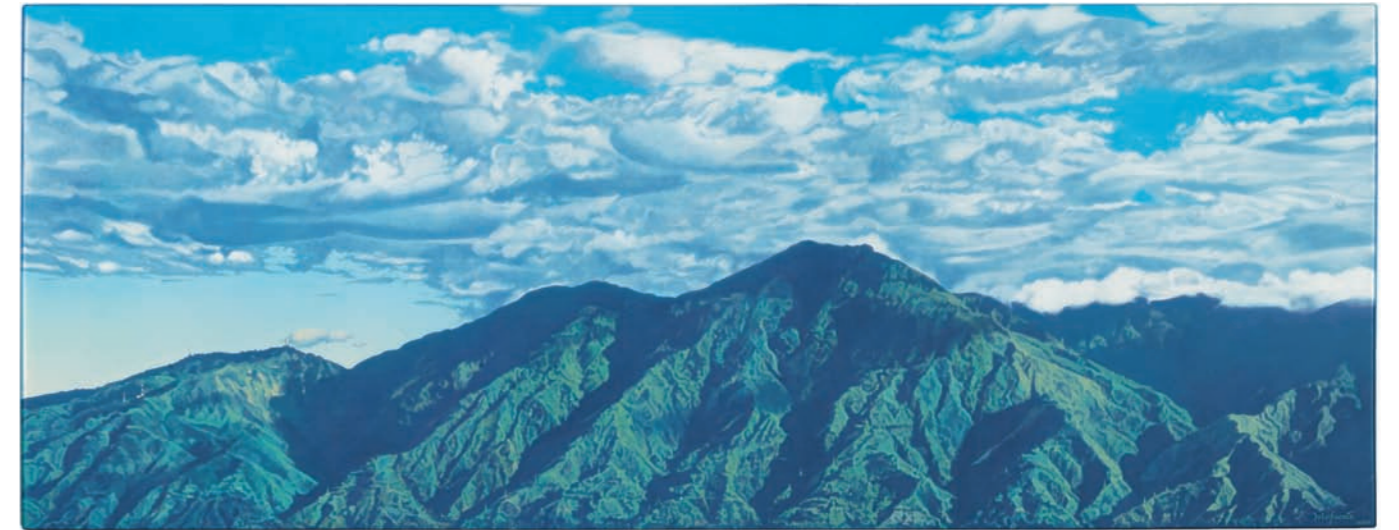
AMANECER CON NUBES, agosto 2007