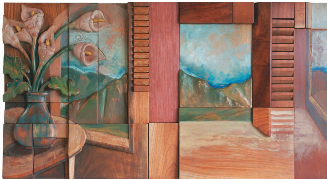
PAISAJE INTERIOR CON ÁVILA DESDE LA VENTANA II, 2007