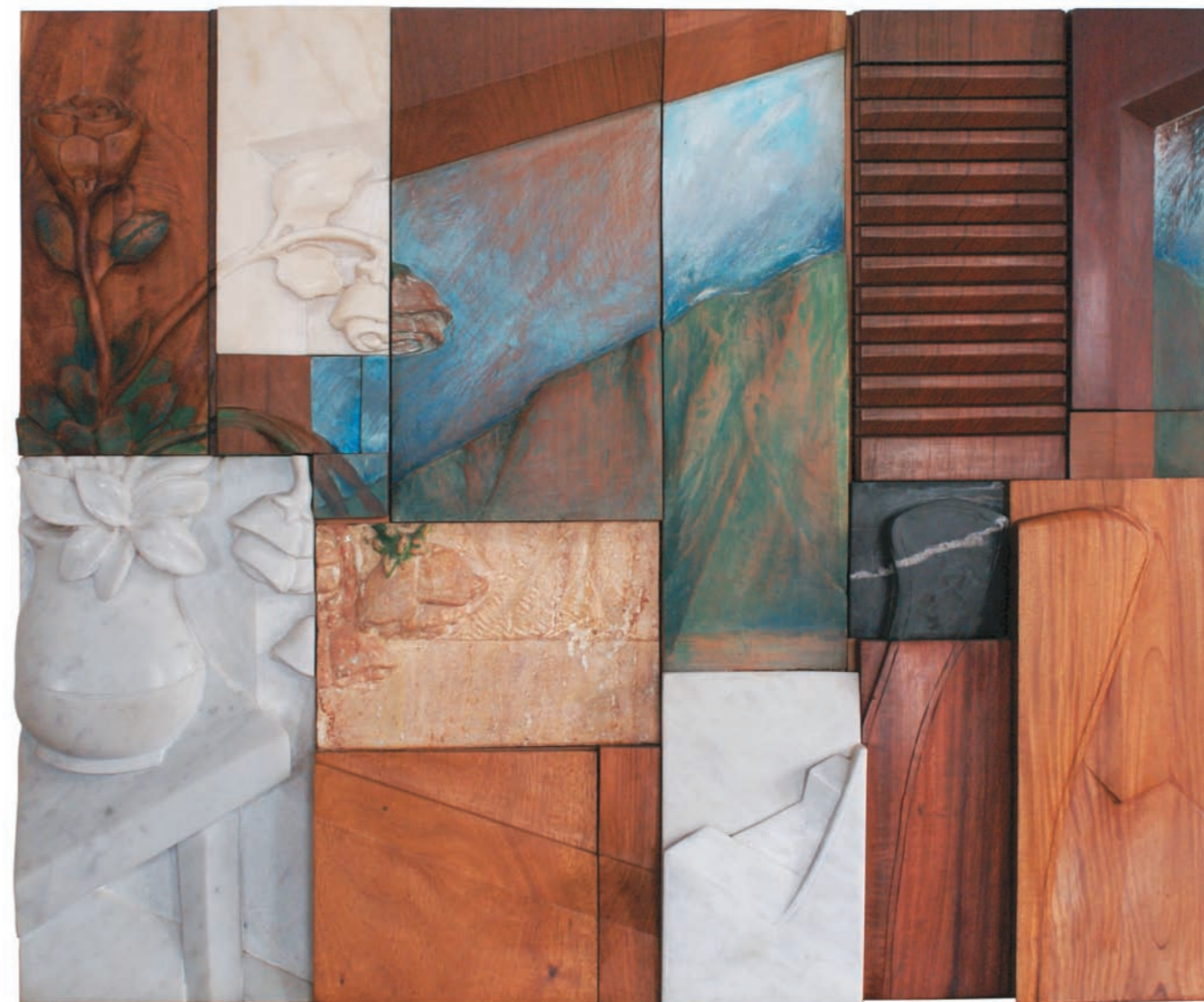
PAISAJE INTERIOR CON ÁVILA DESDE LA VENTANA, 2007