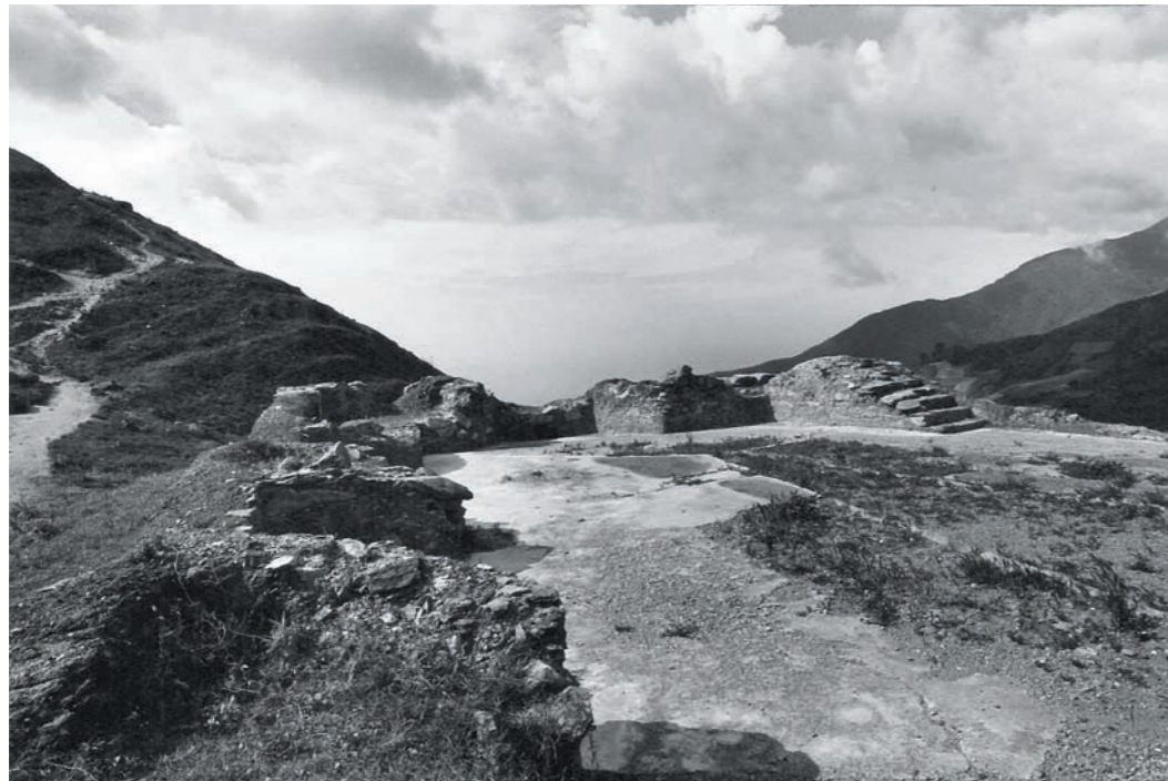
CAMINO REAL, 1984