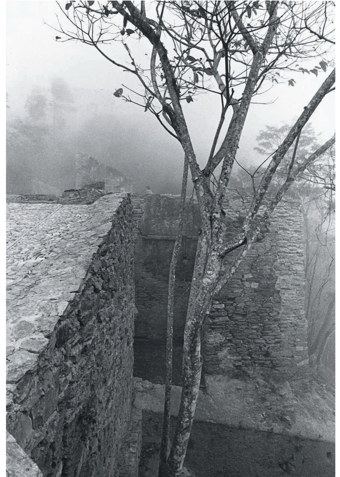
CAMINO REAL, 1984