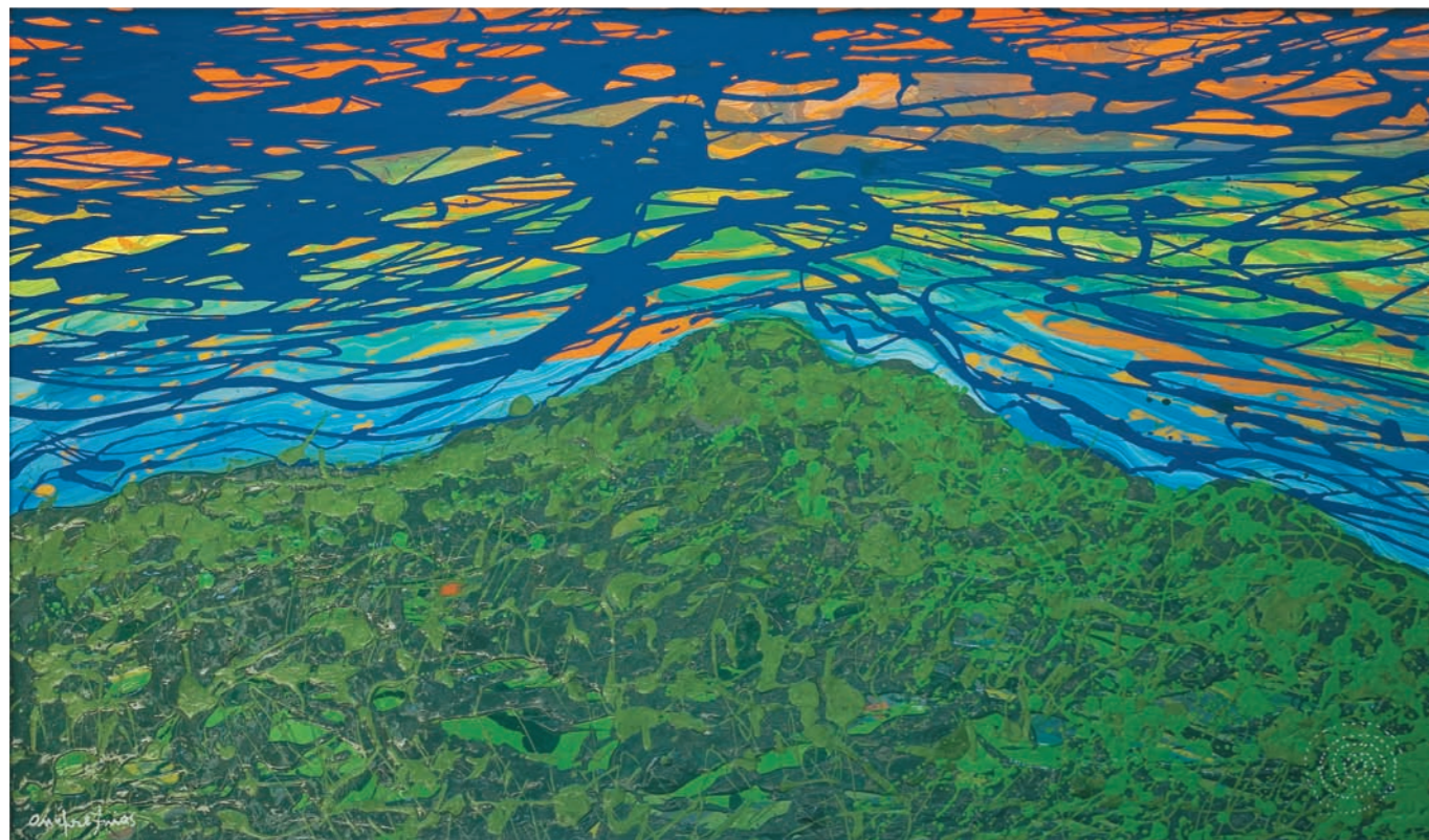
ÁVILA CARIBE I, 2008