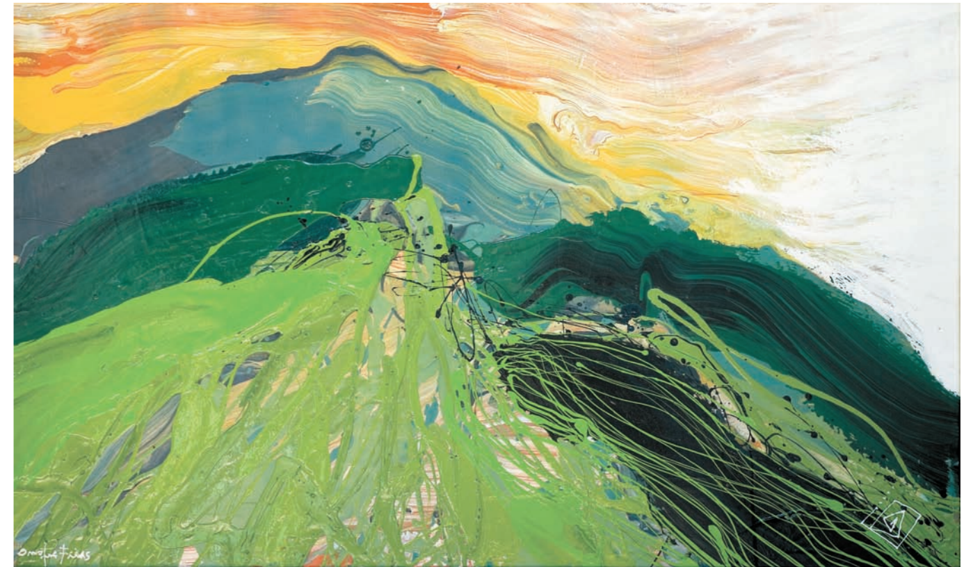
ÁVILA CARIBE II, 2008