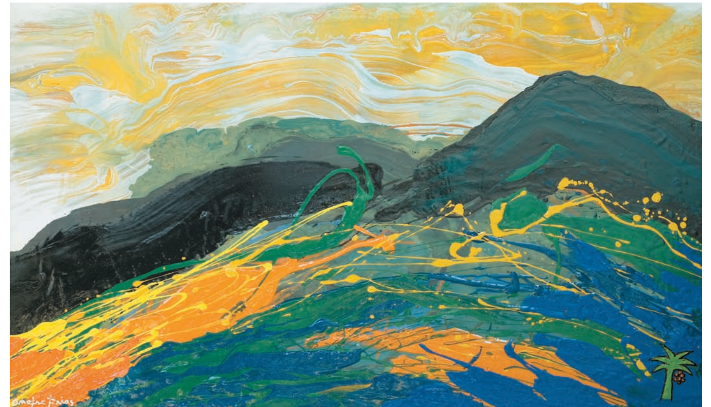
ÁVILA CARIBE III, 2008