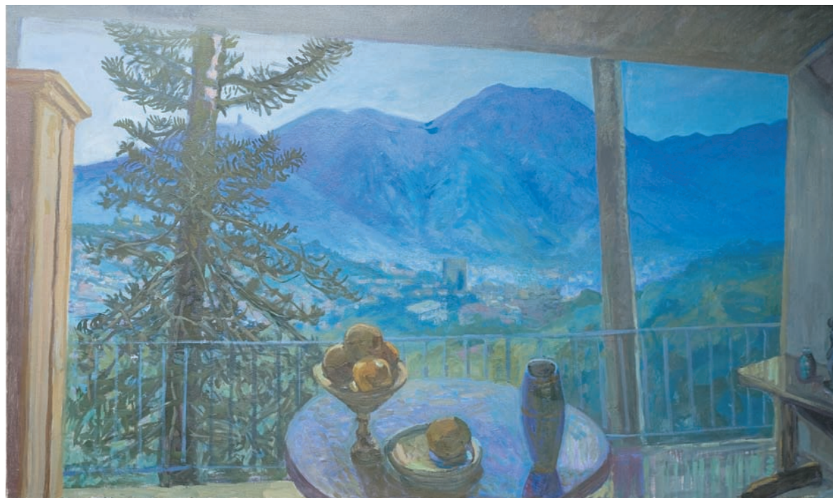
EL ÁVILA DESDE MI BALCÓN, 2000