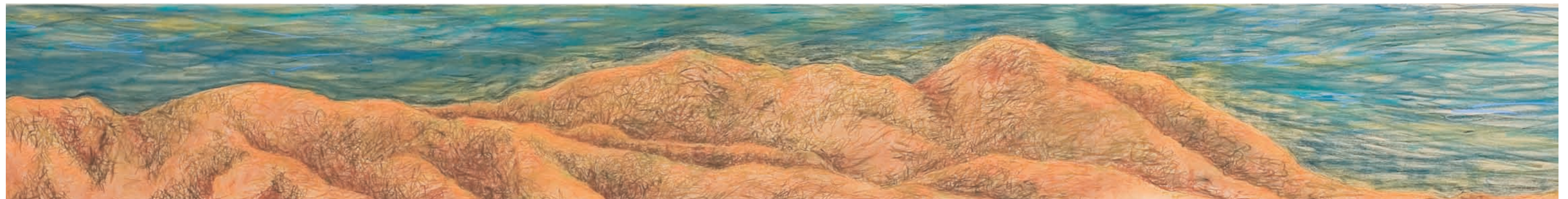
ÁVILA INSINUANTE, 2007-8