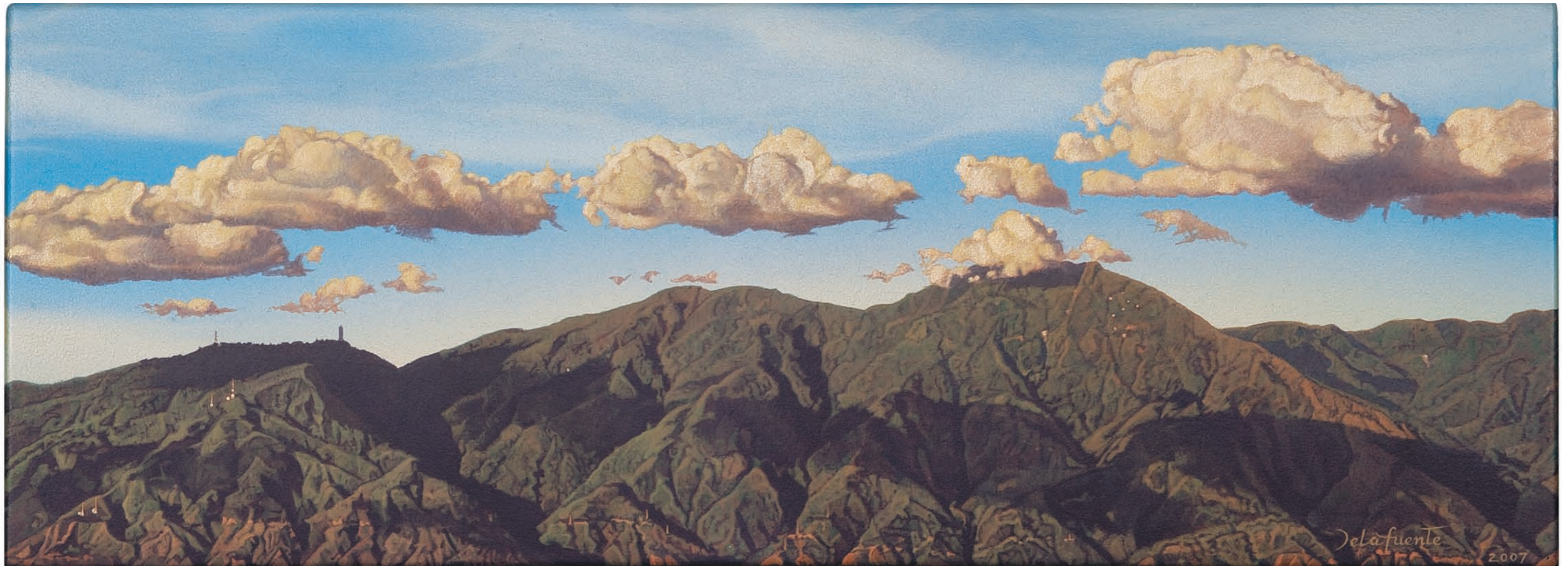
NAIGUATÁ CON NUBES, noviembre 2003