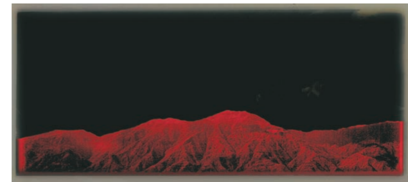
DE LA SERIE TESTIGO I Y II, 1996