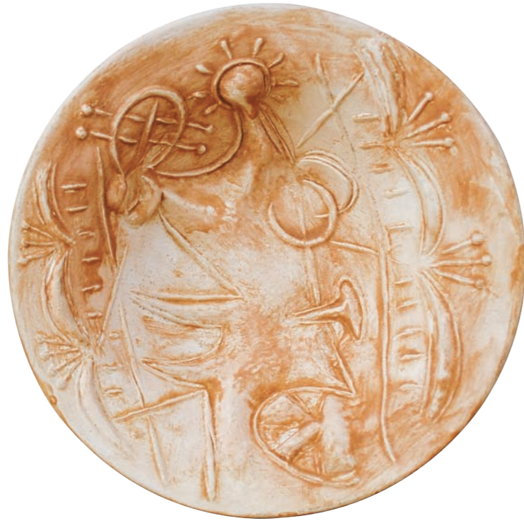
PERSONAJE VEGETAL III, 1981 Plato redondo cóncavo. Arcilla de Carora. Imagen relieve y engobe frotado. Ø 23,5 cm, profundidad 5,5 cm