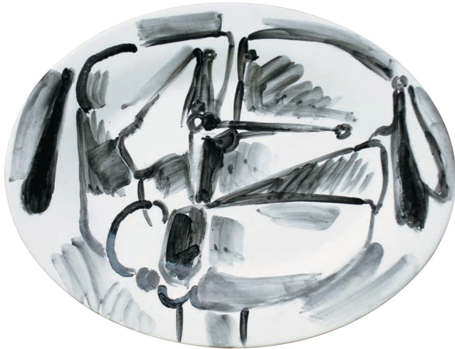
CABEZA EN BLANCO Y NEGRO I, 1981 Plato ovalado. Arcilla de Carora y óxidos a la parafina bajo cubierta. 24,5 x 32 cm