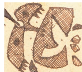
HOJA, 1953 DIBUJO. 4,7 x 5,4 CM

Ambas etapas renuevan cada vez el suspenso que, en el pintor; se expresa con un sudor frío, allí, frente a las interrogantes de la tela; y en el ceramista, con un sudor caliente, como es de esperarse de un arte que es hecho una parte por el hombre y las otras dos por la tierra y el fuego.