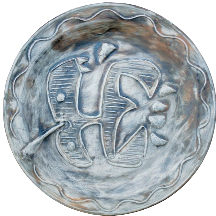
HOJA II, 1981 Plato redondo. Arcilla de Carora. Figura relieve reforzada con engobe. Ø 25,5 cm