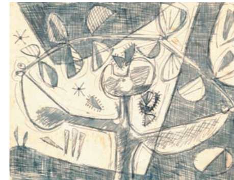
PERSONAJE VEGETAL, 1953 DIBUJO. 10,5 x 12 CM