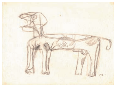
PERRO, 1952 DIBUJO. 16,5 x 21,7 CM