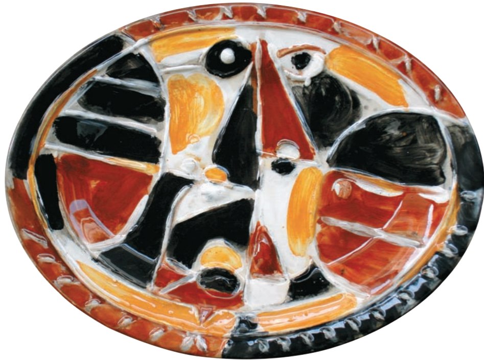
ROSTRO II, 1981 Plato ovalado. Arcilla de Carora. Esmalte bajo cubierta. 22,7 x 30 cm