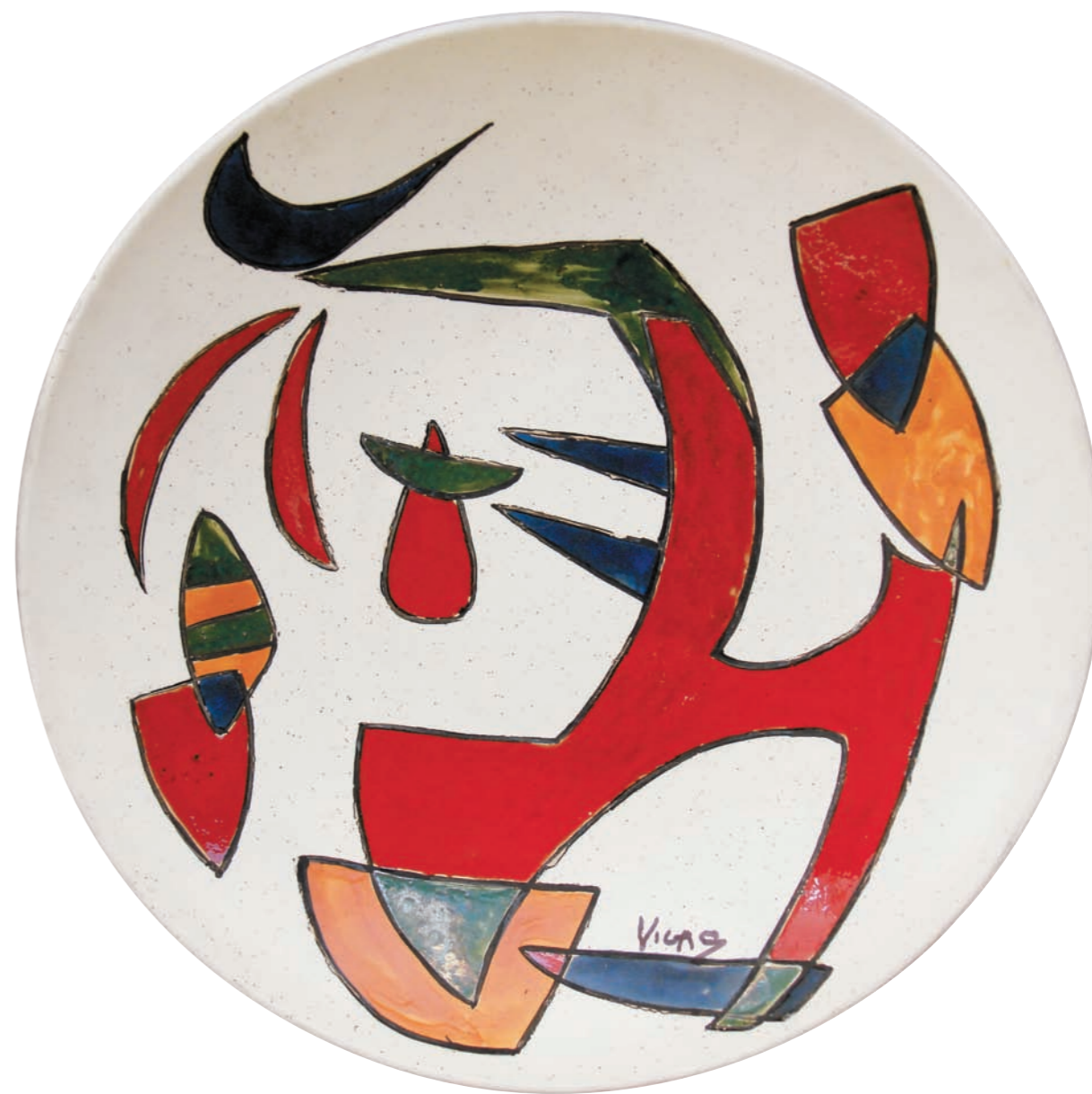
ANIMAL, 1981 Plato redondo cóncavo. Arcilla de Carora. Figura coloreada al esmalte. Ø 35 cm, profundidad 6,5 cm