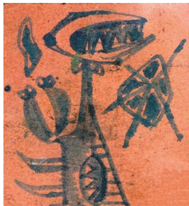
FIGURA INSECTÍVORA, 1953 DIBUJO. 5,4 x 4,7 CM