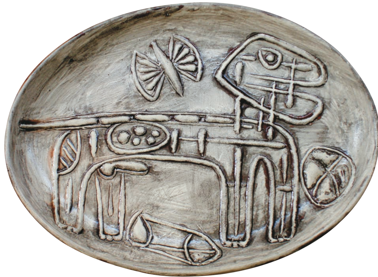
EL NOVIO DE ZORBA, 1981 Plato ovalado. Arcilla de Carora. Imagen relieve y esmalte frotado bajo cubierta. 20,7 x 27,5 cm

Con la exposición TIERRA Y FUEGO, la Fundación BBVA Banco Provincial desea rendir homenaje al maestro Oswaldo Vías, destacado artista de fecunda y extensa trayectoria que continúa desarrollando en diferentes campos de la plástica.