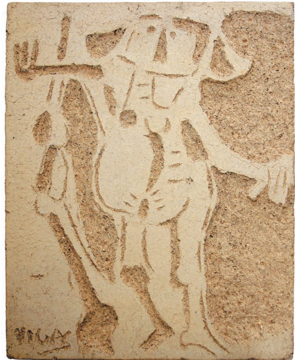
DONCELLA, 1981 Placa rectangular. Grés con incisiones. 37 x 30 x 4 cm