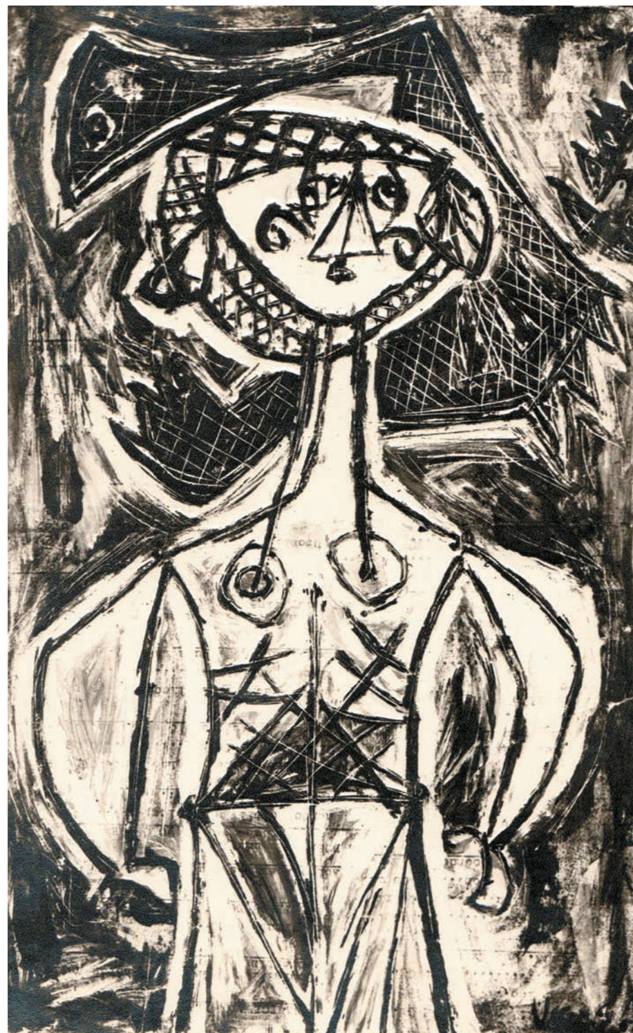
BRUJITA, 1951 Óleo sobre papel. 38 x 24 cm