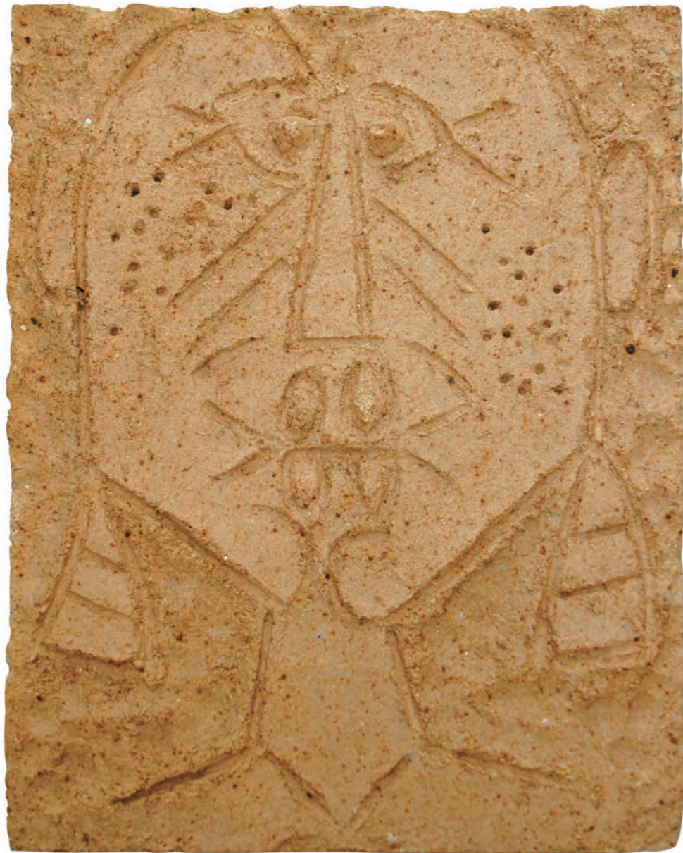
ROSTRO II, 1981 Placa rectangular. Incisiones y relieve sobre material refractario industrial. 36,5 x 29,4 x 5 cm