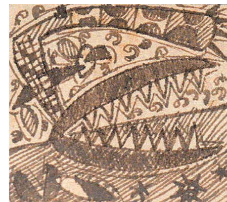
INSECTÍVORA, 1953 DIBUJO. 5,4 x 4,7 CM