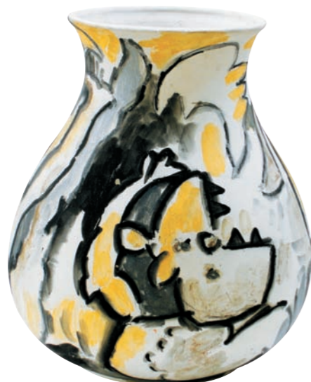
PARA JANINE, 1981 Jarrón en bizcocho. Figura en engobe sin quemar. 25 x 22 cm