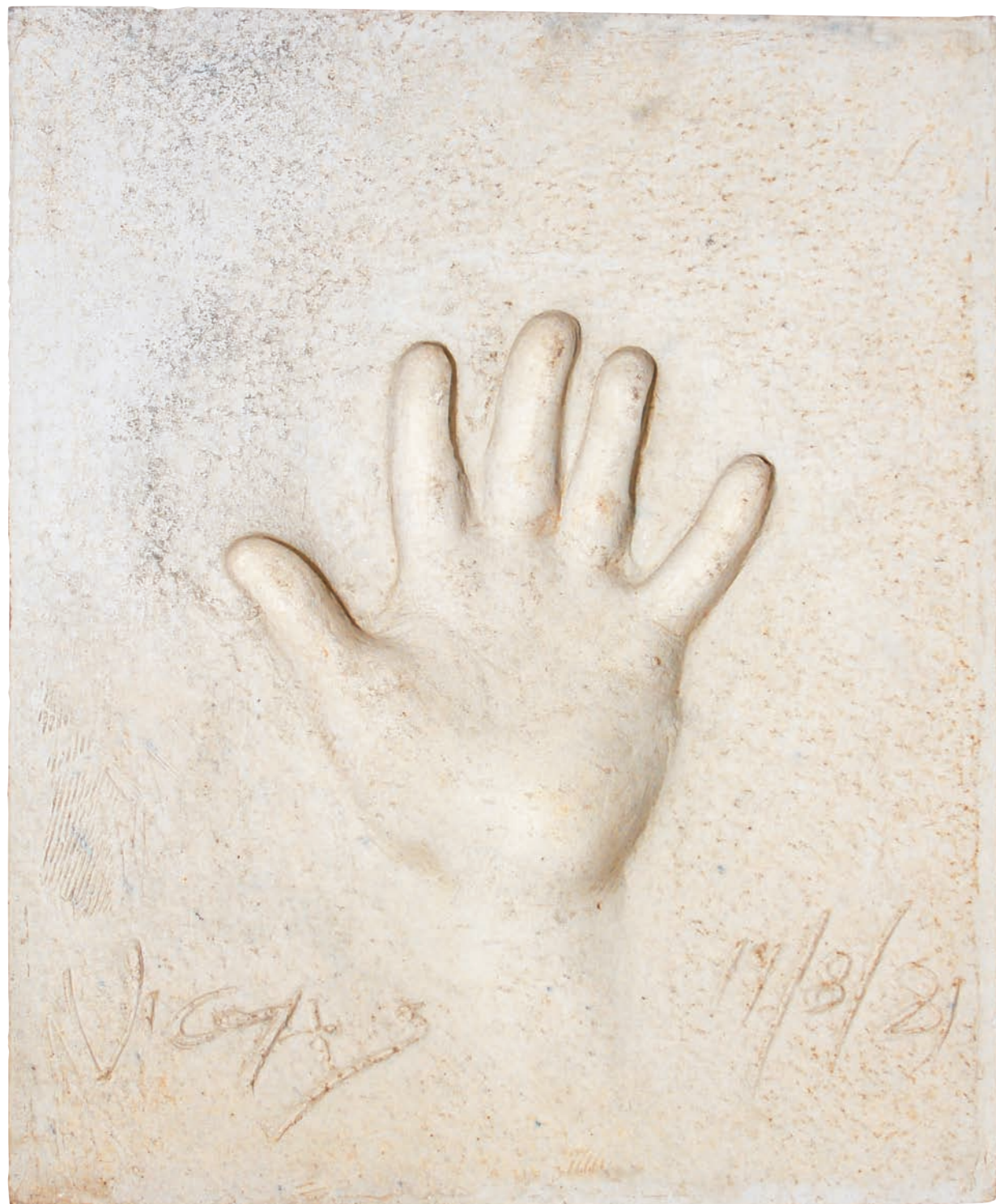
OSWALDO VIGAS CERÁMICAS