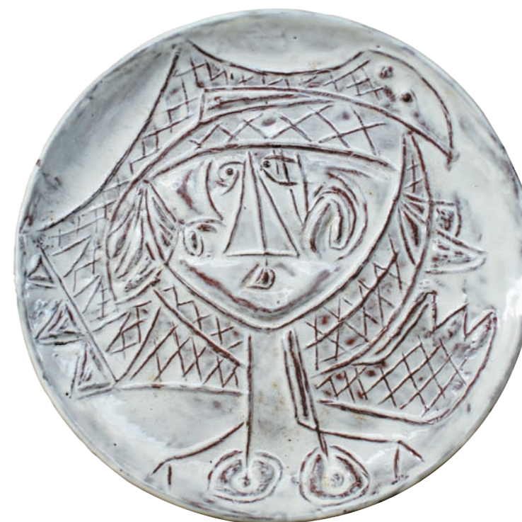
CABEZA DE BRUJITA VIII, 1981 Plato redondo. Arcilla de Carora. Esmalte y engobe frotado. Ø 23,5 cm