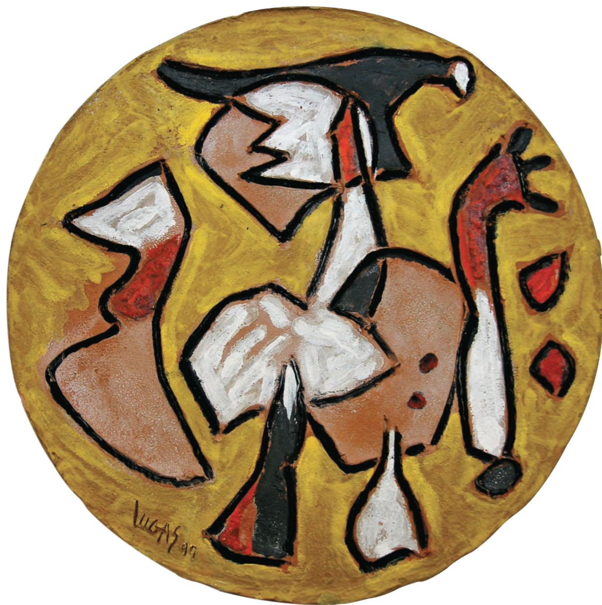
FIGURA I, 1999 Placa redonda. Arcilla. Figura incisa en bajo relieve con esmalte. Ø 37 cm