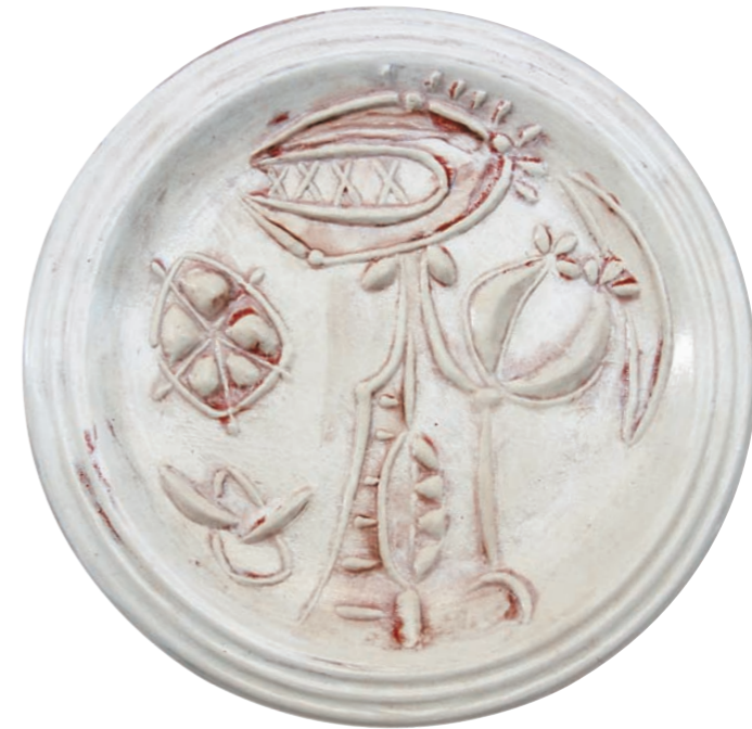
FIGURA INSECTÍVORA, 1981

Plato redondo. Arcilla de Carora. Imagen relieve y engobe frotado bajo cubierta. Ø 30 cm