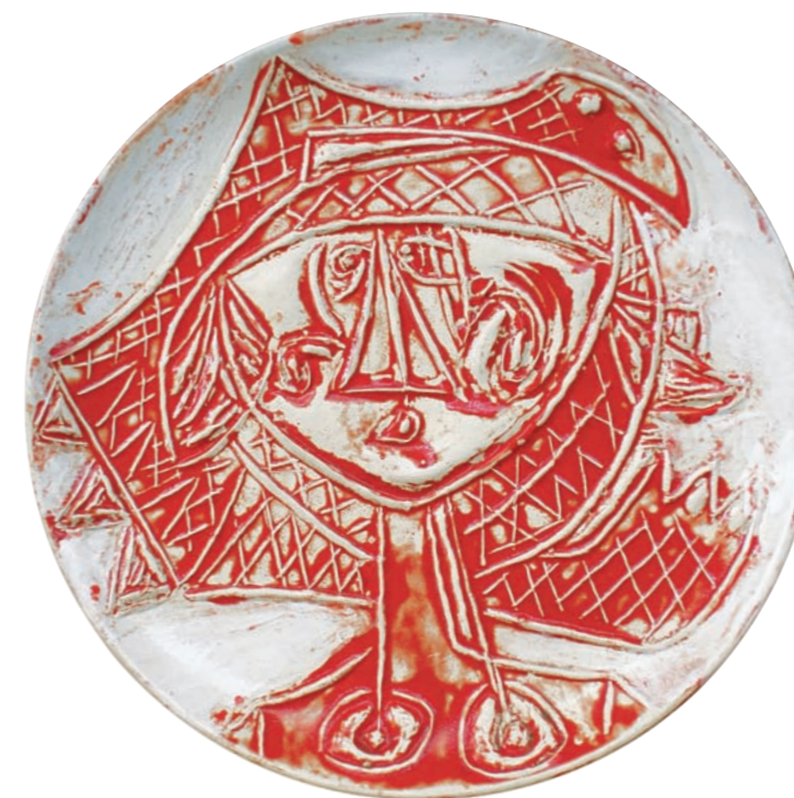
CABEZA DE BRUJITA VII, 1981 Plato redondo. Arcilla de Carora. Esmalte y engobe frotado bajo cubierta. Ø 23,5 cm