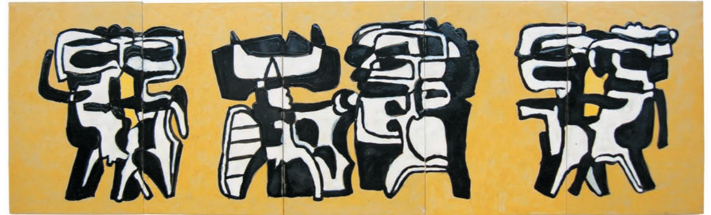
PROYECTO PARA MURAL I, 1981 Cerámicas rectangulares (5 piezas). Esmalte y óxidos a la parafina bajo cubierta. 29,5 x 98,5 cm