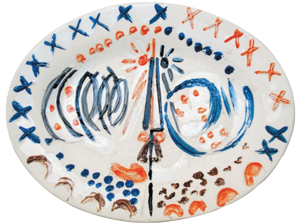
CABEZA SOL, 1981 Plato ovalado. Arcilla de Carora. Imagen relieve y óxidos de parafina bajo cubierta. 23,5 x 31 cm