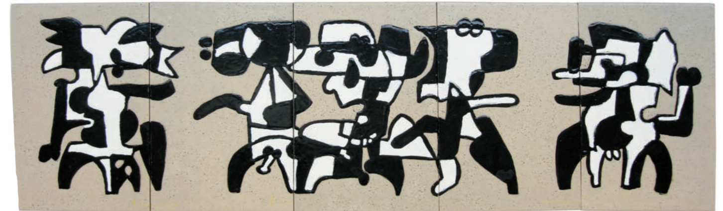
PROYECTO PARA MURAL II, 1981 Cerámicas rectangulares (5 piezas). Esmalte y óxidos a la parafina bajo cubierta. 29,5 x 98,5 cm