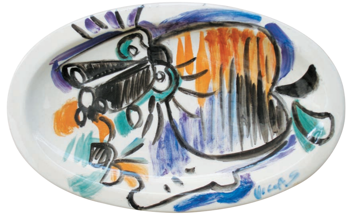
CABEZA VI, 1981 Plato ovalado. Arcilla de Carora y óxidos a la parafina bajo cubierta. 25,5 x 40,5 cm