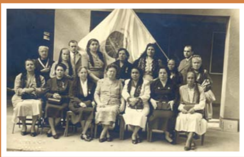
Pietri & Cia. Cofradía Última Cena, años 40