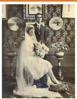
Anónimo. Novios García, 1908