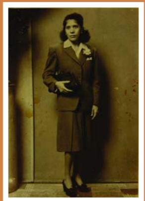
Anónimo. Lista para el trabajo, 1941