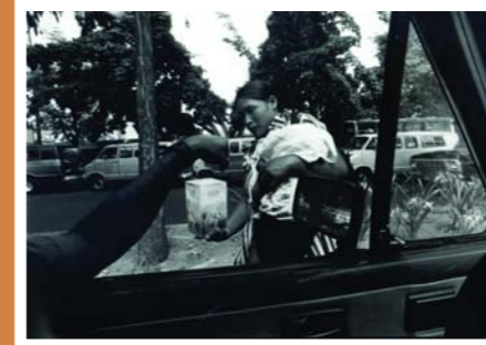
Nelson Garrido. Warao como limosnera, Caracas, 2003

Aunque unos aspectos se han minimizado, como los prejuicios raciales, la intolerancia religiosa o la discriminación, otros se han asentado, como la