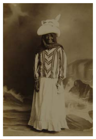
Nemesio Baralt. Cacica Guajira, 1880