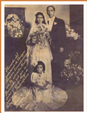
Anónimo. Matrimonio, 1942

tores de la sociedad civil. En la fase de consolidación democrática las mujeres de los partidos jugaron un rol estelar y su influencia ha seguido siendo definitiva en los logros que continuaron obteniéndose en esa lucha."(3)