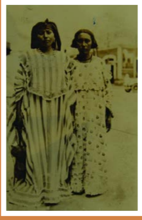
Ferbus. Guajiras con elegantes trajes típicos, años 40

Nace la participación política femenina. "Es importante hacer notar que en la experiencia venezolana, las vanguardias han sido conformadas por mujeres vinculadas al proceso político y más concretamente a los partidos a diferencia de otros países, donde las iniciativas reivindicativas han emergido de otros sec-